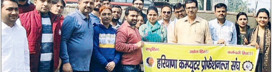
पानीपत। डीआईटीएस के कर्मचारी प्रदर्शन करते हुए।