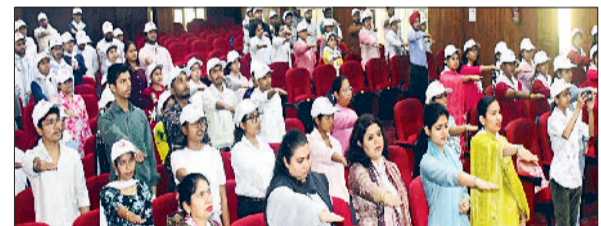
एसडी कॉलेज में जनसेवा की शपथ लेते हुए प्रशिक्षण ले रहे युवा।