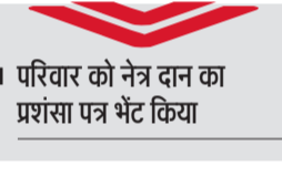
परिवार को नेत्र दान का प्रशंसा पत्र भेंट किया